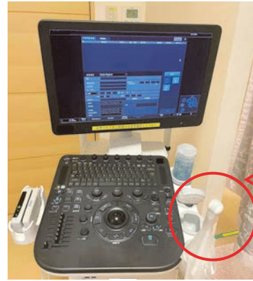
経膣超音波の プローブ

膣から超音波検査用の細長い器具（プローブ）を挿入し、子宮や卵巣を観察する検査です。プローブの大きさは約2cmで、先端から超音波が出ており骨盤の中を観察できます。子宮筋腫、卵巣のう腫、子宮内膜ポリープなどの診断に有用な検査です。放射線検査ではありませんので、被ばくの心配はいりません。